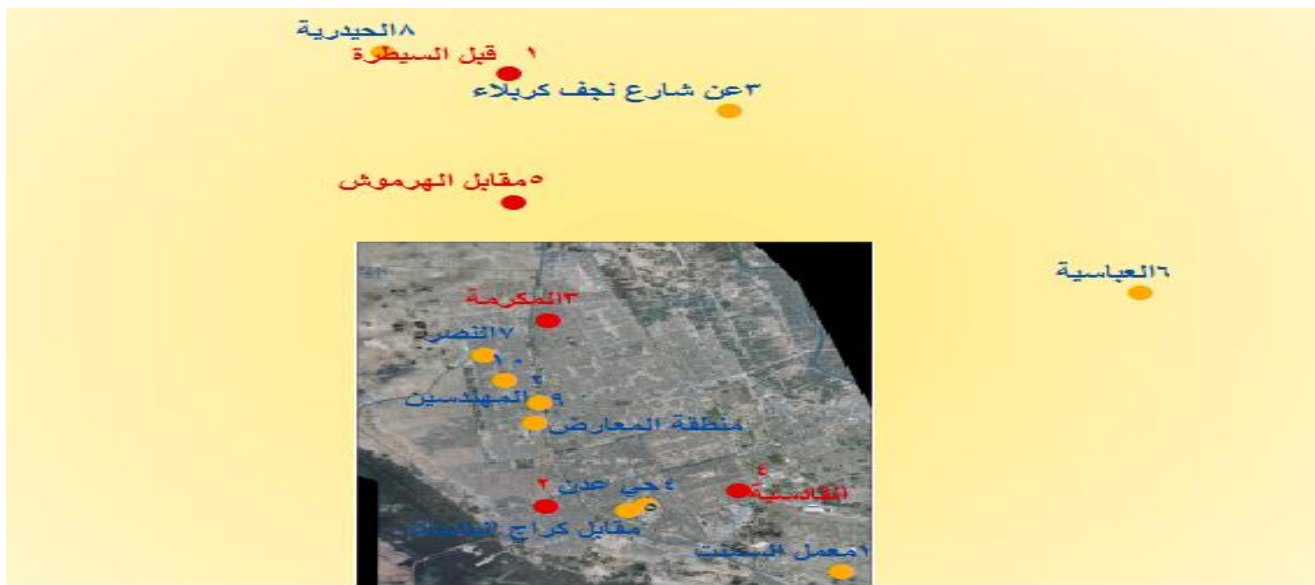
الشكل رقم (1): يوضح المواقع المفحوصة في محافظة النجف الاشرف