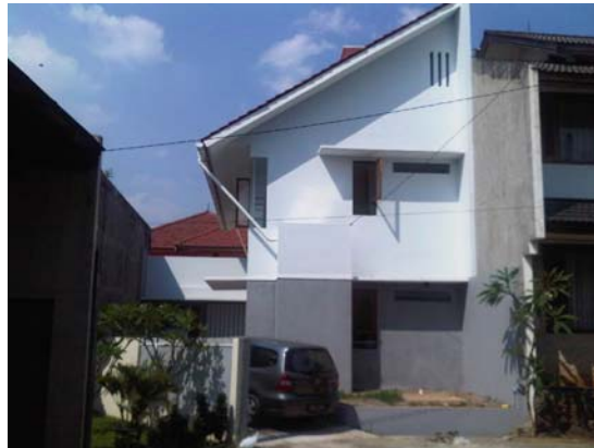
Gambar 2. Rumah tinggal yang menggunakan sistem pemanfaatan air hujan.

Namun ada beberapa kekurangan tipe pengumpulan air hujan dengan menggunakan atap, yaitu ukurannya yang terbatas. Dan akan sangat mahal apabila atap ini dibuat ekstra sendiri untuk menangkap air hujan (tidak ada dalam eksisting).