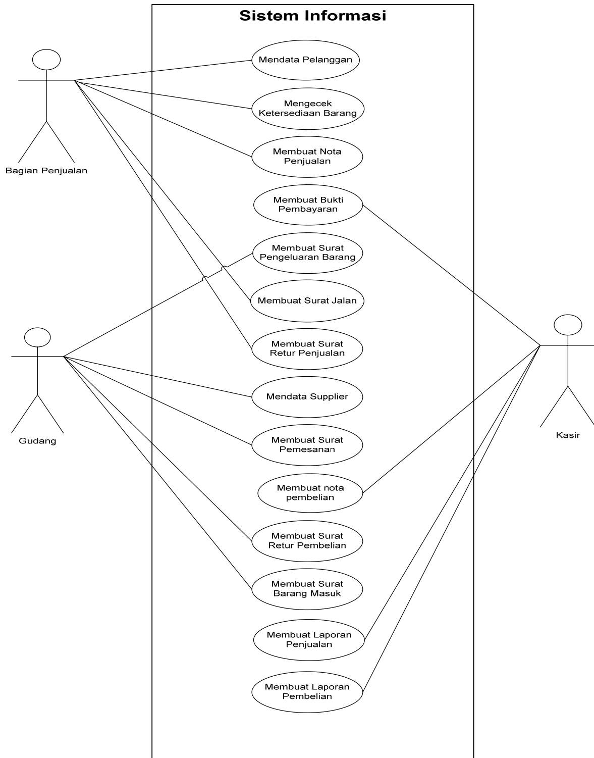
Gambar 1 Use case diagram

antara satu dengan lain berdasarkan penghubung/asosiasi yang disesuaikan. Menurut (Bennett, McRobb, & Farmer, 2006) class diagram adalah suatu diagram UML yang berisi kumpulan class beserta atribut dan hubungan antara class satu dengan yang lainnya. Pengertian atribut sendiri mengacu pada elemen dari struktur data yang saling terintegrasi dengan operasinya. Berikut class diagram dari sistem informasi yang diusulkan (Gambar 2).