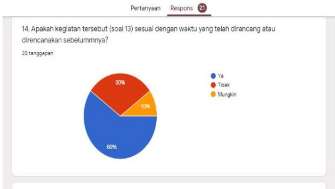
Gambar 11. Kesesuaian waktu yang dirancang

11. Apakah kegiatan tersebut sesuai dengan waktu yang telah dirancang.