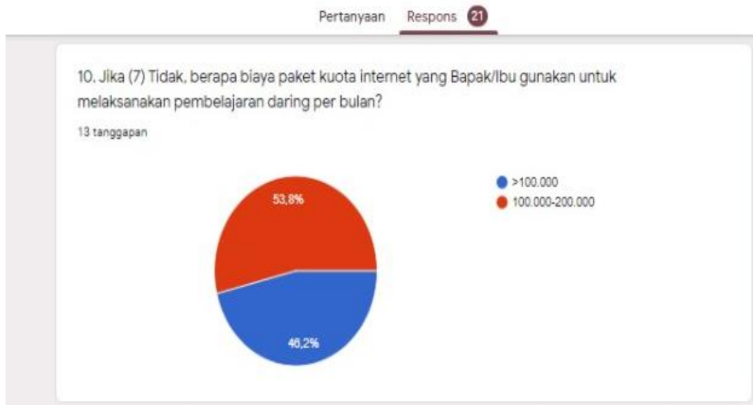
Gambar 7. Besaran biaya yang digunakan