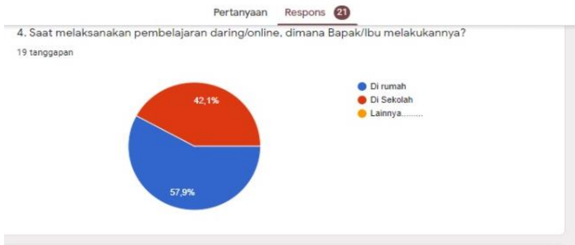
Gambar 1. Tempat Berlangsungnya Pembelajaran Daring/Online

Berdasarkan diagram lingkaran di atas tentang respon guru bahasa indonesia terhadap pembelajaran daring di era pandemi covid-19 dapat dijelaskan mengenai tempat pembelajaran daring saat guru melaksanakan pembelajaran. Pertama , 57,9 % guru memberikan respon bahwa melaksanakan pembelajaran daring di rumah. Kedua , 42,1% guru memberikan respon bahwa melaksanakan pembelajaran daring di sekolah. Dan beberapa persen lainnya menjawab lainnya. Jadi, dapat disimpulkan bahwa para guru melakukan pembelajaran daring di rumah.