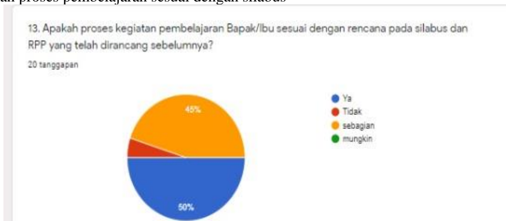
Gambar 10. Kesesuaian dengan silabus