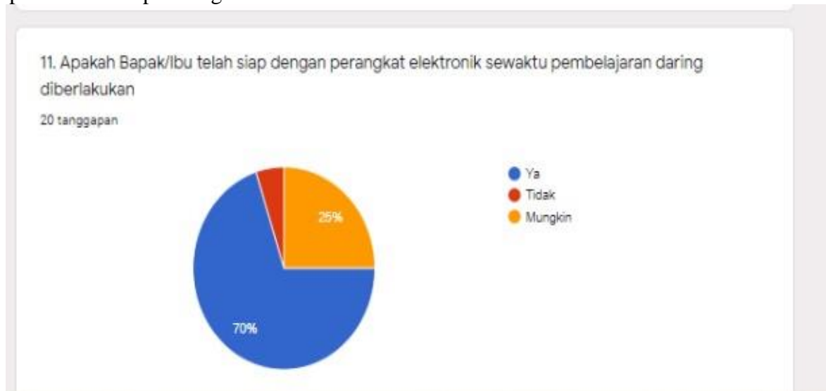
Gambar 8. Persiapan perangkat elektronik

Berdasarkan diagram lingkaran di atas tentang respon guru bahasa Indonesia terhadap pembelajaran daring di era pandemi covid-19 dapat dijelaskan mengenai apakah telah siap perangkat elektronik. Pertama , 70% menjawab ya. Kedua , 25% menjawab mungkin. Jadi, dapat disimpulkan bahwa para guru telah siap dengan perangkat elektronik sewaktu pembelajaran daring diberlakukan.