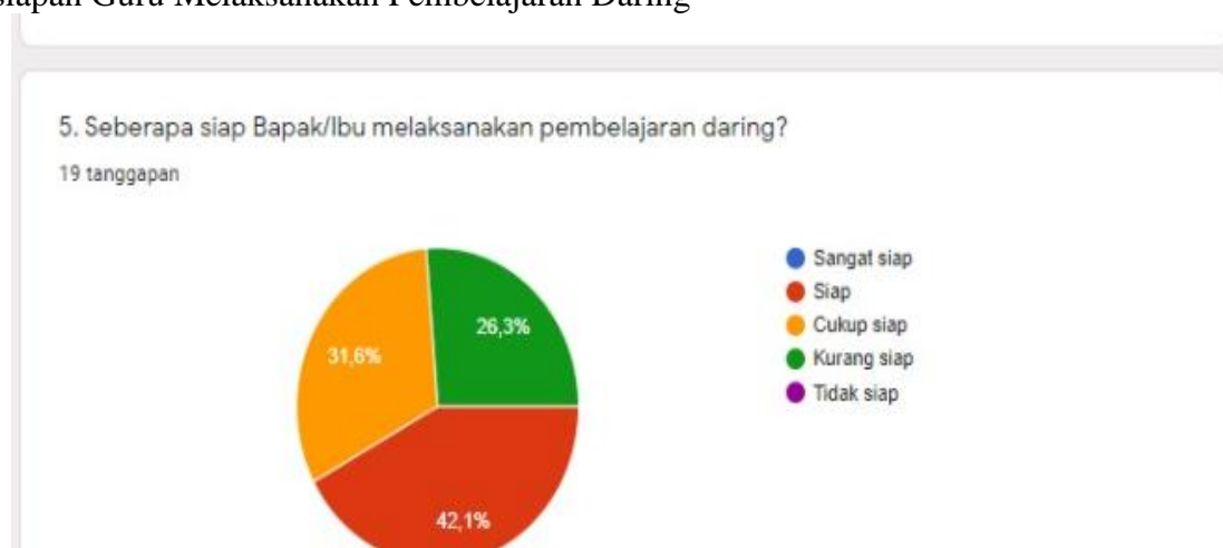
Gambar 1. Kesiapan Guru Melaksanakan Pembelajaran Daring