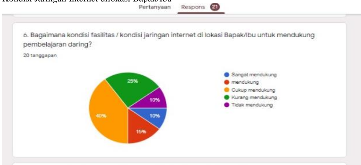
Gambar 3. Kondisi Jaringan Internet dilokasi Bapak/Ibu

Berdasarkan diagram lingkaran di atas tentang respon guru bahasa Indonesia terhadap pembelajaran daring di era pandemi covid-19 dapat dijelaskan mengenai kondisi jaringan internet dilokasi bapak/ibu . Pertama , 42% menjawab cukup mendukung. Kedua , 25% menjawab kurang mendukung. Ketiga , 15% guru menjawab mendukung. Keempat , 10% guru menjawab tidak mendukung. Jadi, dapat disimpulkan bahwa kondisi jaringan internet dilokasi para guru dalam mendukung pembelajaran daring cukup mendukung.