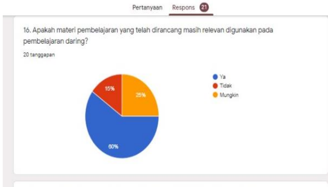
Gambar 13. Relevansi materi dengan pembelajaran daring

13. Apakah materi yang digunakan masih relevan dengan pembelajaran daring.