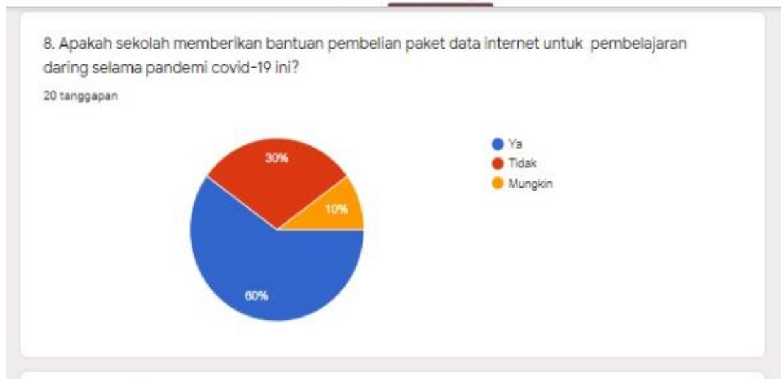
Gambar 5. Bantuan Internet Untuk Pembelajaran Daring

Berdasarkan diagram lingkaran di atas tentang respon guru bahasa Indonesia terhadap pembelajaran daring di era pandemi covid-19 dapat dijelaskan mengenai apakah sekolah memberikan bantuan internet untuk pembelajaran daring. Pertama , 60% guru menjawab mendapat bantuan. Kedua , 30% menjawab tidak mendapat bantuan. Ketiga , 10% menjawab mungkin mendapatkan bantuan. Jadi, dapat disimpulkan bahwa sekolah memberikan bantuan pembelian paket data internet untuk pembelajaran daring selama pandemic covid-19.