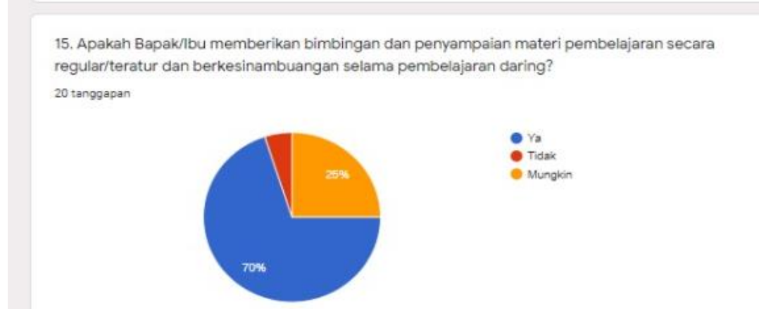
Gambar 12. Pembimbingan belajar secara reguler

12. Apakah bapak/ibu memberikan bimbingan dan menyampaikan pembelajaran secara reguler.