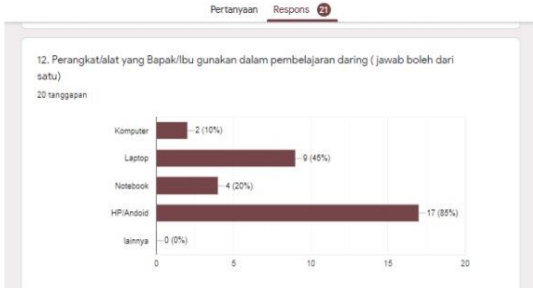
Gambar 9. Perangkat yang digunakan

Berdasarkan diagram lingkaran di atas tentang respon guru bahasa Indonesia terhadap pembelajaran daring di era pandemi covid-19 dapat dijelaskan mengenai perangkat/ alat yang digunakan dalam pembelajaran daring. Pertama , 85% menjawab hp android. Kedua , 45% menjawab laptop. Ketiga , 20% menjawab komputer. Keempat , 10% menjawab notebook. Jadi, dapat disimpulkan perangkat yang digunakan para guru dalam pembelajaran daring adalah hp android.