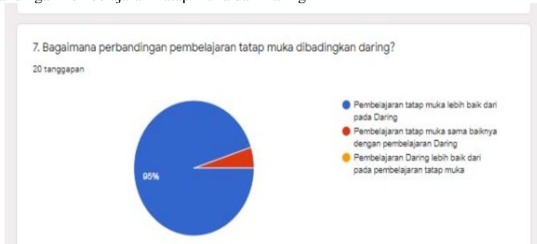
Gambar 4. Perbandingan Pembelajaran Tatap muka dan Daring

Berdasarkan diagram lingkaran di atas tentang respon guru bahasa Indonesia terhadap pembelajaran daring di era pandemi covid-19 dapat dijelaskan mengenai perbandingan pembelajaran tatap muka dan daring. Yang pertama, 95% menjawab pembelajaran tatap muka lebih baik dari pembelajaran daring. Dan beberapa persen lainnya menjawab sama baik. Jadi, dapat disimpulkan bahwa pembelajaran tatap muka lebih baik dari pada daring.