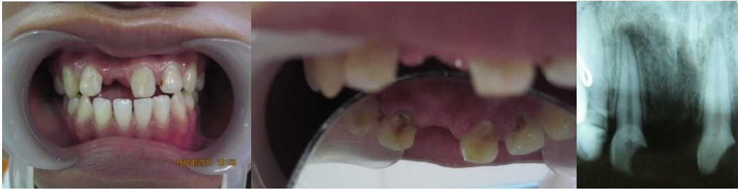
Gambar 1. Foto intraoral dan foto radiograf awal