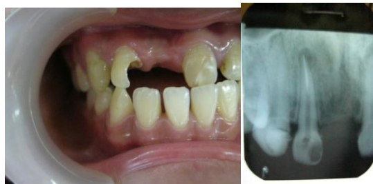
Gambar 3. gambaran klinis dan radiografis setelah dilakukan preparasi dan pembuatan saluran pasak.