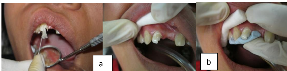
Gambar 4. (a) Penginsersian pasak fiber reinforced composites , (b) Penggunaan putty untuk pedoman penumpatan palatal