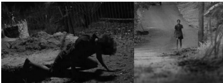
Figura 1. Cena de Avenida Brasil: Nina após ser enterrada viva