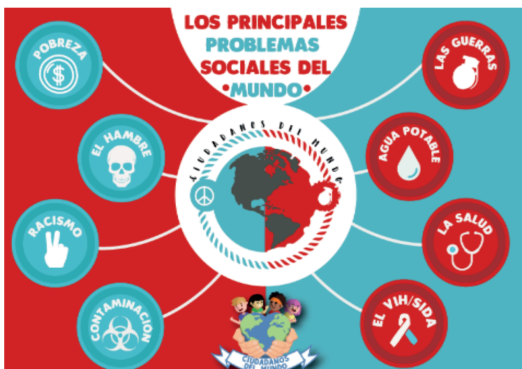
Figura 2. Infografía de estudiantes

Estamos desbordando la copa que contiene una indiferencia destructora. Los problemas que estamos enfrentando globalmente no son solo responsabilidad de una persona, de un país o de un grupo social, ¿qué es lo que estamos haciendo? Estamos solo observando a nuestros “hermanos” destruirse mutuamente como pasa en las guerras sin sentido, observando a los que podrían ser nuestros hijos muriendo por desnutrición, observando cómo la corrupción enriquece a los delincuentes y empobrece al pueblo. ¿Qué nos pasa? Dejemos de observar solamente y callar, los problemas se solucionan aportando así sea solo un granito de arena; los problemas no son de los demás, los problemas son de todos. Así como dijo un filósofo ruso llamado Mijail Bakunin, “Mi patria es el mundo; mi familia la humanidad”.