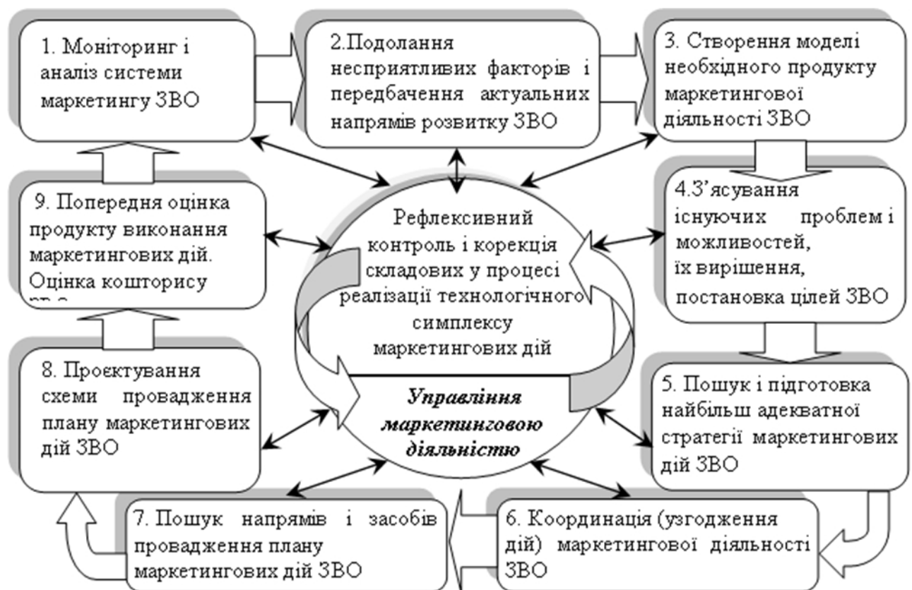
Рис. 1. Технологічний симплекс проектування маркетингової діяльності ЗВО

Перша складова технологічного симплексу – моніторинг і аналіз системи маркетингу ЗВО. Управлінська практика свідчить, що зазначену складову доцільно реалізовувати із залученням маркетингової служби. Адже до обов'язків