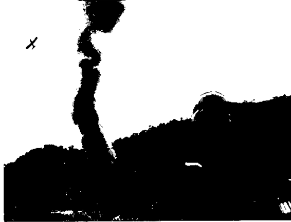
Quema de laboratorio de procesamiento de coca

Sorprende en los expedientes la recurrencia al término “derechos humanos”, omnipresente en América Latina en los años recientes. ¿Por qué no habla simplemente de delitos? Aventuro una hipótesis: es tal la fortuna de la noción de derechos humanos, es tan grande su don para activar denuncias y grupos específicos, que en la práctica se da un giro semántico. Hoy, derechos humanos incorpora todo lo que afecta a la sociedad, lo relativo a las agresiones del gobierno y los otros grupos de poder, lo que exige respuestas a la vez judiciales, jurídicas, políticas, éticas. Al hablarse de derechos humanos, se convoca al lado del pronuntario judicial la actitud moral.