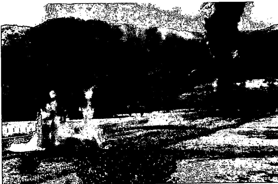
Voladura de pistas

Los periodistas asesinados por cualquiera de las fuerzas empeñadas en diluir la presencia del Estado, buscaban, cada uno a su modo, la justicia, en su doble vertiente: castigo de los culpables y prevención de la existencia de nuevas víctimas. Si no es un mérito ser víctima, sí lo es el impedir que los victimarios se ufanen de lo que han hecho y lo que piensan hacer. Por eso, el reportero investigativo está muy consciente de su rasgo distintivo: será leído, ya es leído, desde la posición de los agraviados, con barbarie, burla, irritación, odio. Si los lectores escasean, el reportero que trabaja sobre casos de corrupción, asesinato, monstruosidades judiciales, sabe que inevitablemente los tendrá entre los ansiosos de ver documentado el horror y los deseosos de perpetuar los climas delincuenciales. Ser leído con pasión que atañe a la vida diaria, es algo fundamental porque, así el proceso no sea muy claro, el reportero condicionado inevitablemente por las atmósferas de intimidación y acoso, también lo está por las voces y los impulsos de la solidaridad. Sí, se les lee desde el ansia revanchista, pero también desde el agradecimiento que admira.